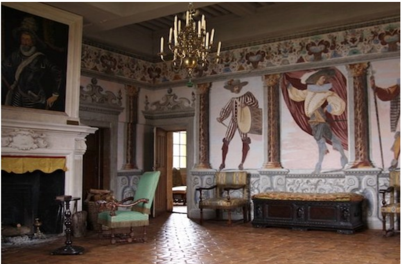
La chambre de la Parade

La visite s'est terminée par une promenade dans les jardin pour apprécier la magnifique façade du château, château qui mérite d'avantage que les 8000 visiteurs annuels.