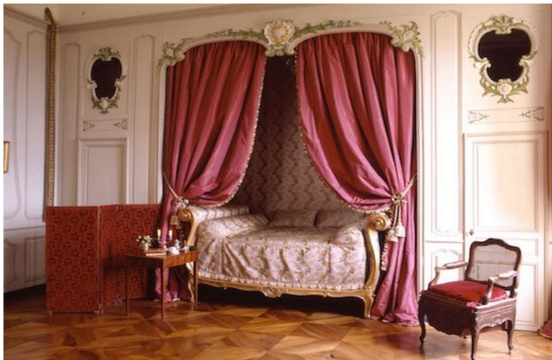
La chambre de la Comtesse de Sève