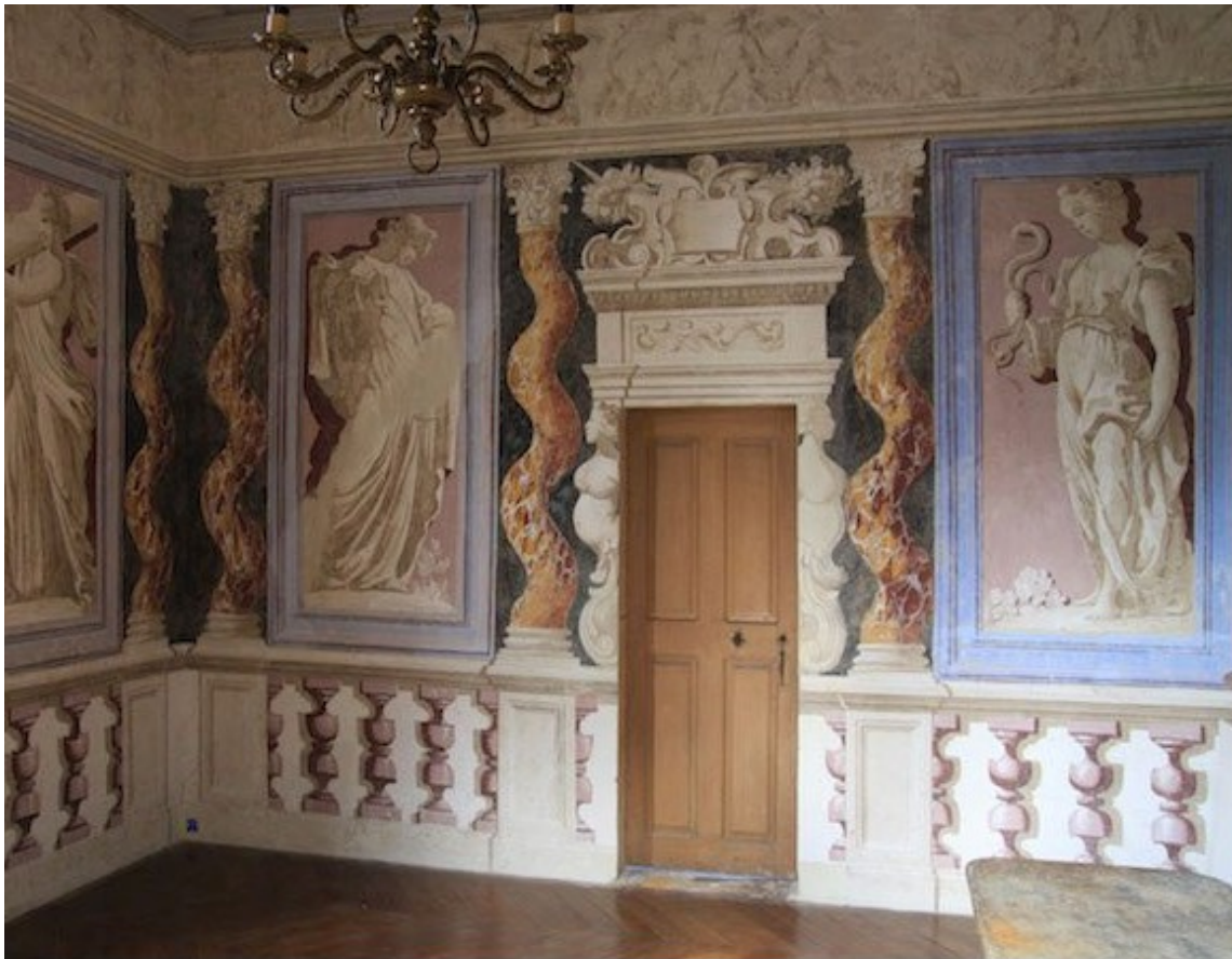
La chambre des vertus